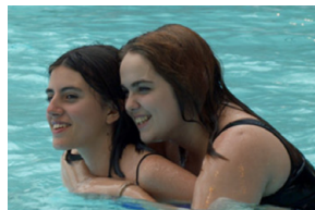
Adolescentes, Sébastien Lifshitz