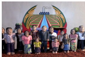
L'Image manquante , Rithy Panh