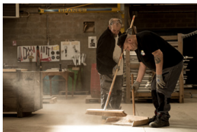
Nouvelle cordée , M.M. Robin ©S. Charrasse