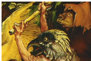
Le Retable des ardents, Alain Jaubert