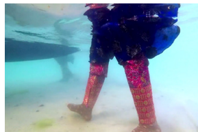
Waterfolks , Azadeh Bizargiti