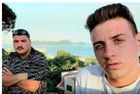
Selfie, Agostino. Ferrente