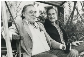
The Charles Bukowski Tapes , B.Schroeder