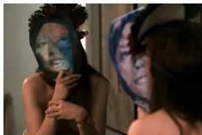
A Bright Light... , Emmanuelle Antille