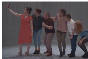
L'Un vers l'autre, Stéphane Mercurio