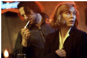
Barfly (Fiction), Barbet Schroeder