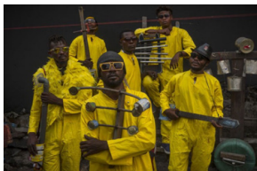
Système K, Renaud Barret