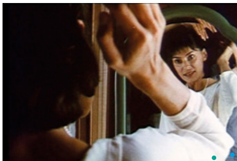
Time Indefinite de Ross McElwee