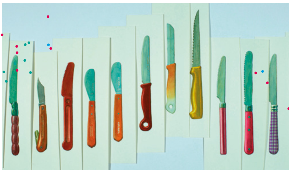
Grand canons d'Alain Biet

imagesenbibliotheques.fr/mois-du-doc/enfants-ados