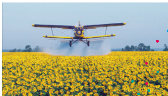
Notre pain quotidien de Nikolaus Geyrhalter