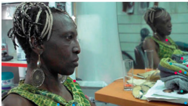
Les Voix du dedans d'Elina Chared

En partenariat avec le festival Premiers regards