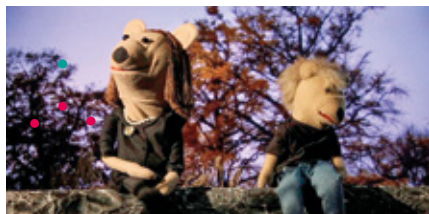
La Sociologue et l'ourson de Mathias Théry et Etienne Chaillou