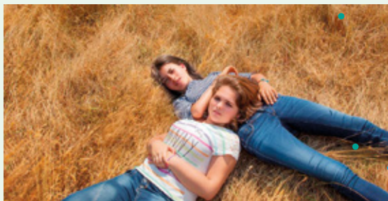
Adolescentes de Sébastien Lifshitz

— Cycles thématiques autour de l'actualité en débat