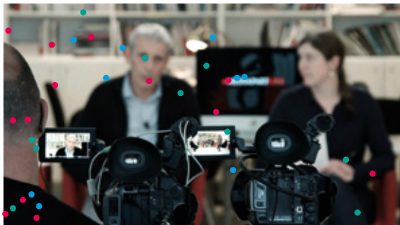
Depuis Mediapart de Naruna Kaplan de Macedo